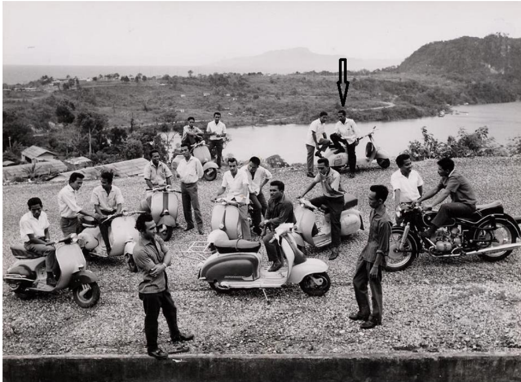
Gedeelte van de 37 (ex-)verstekelingen voor hun vertrek naar Nederland. Dok 8, Hollandia (1962).

In Nederland kwam hij in Amersfoort terecht. Hij ging vervolgens in Duitsland op toernee als bassist bij de Tielman Brothers en heeft daar 9 maanden gespeeld.